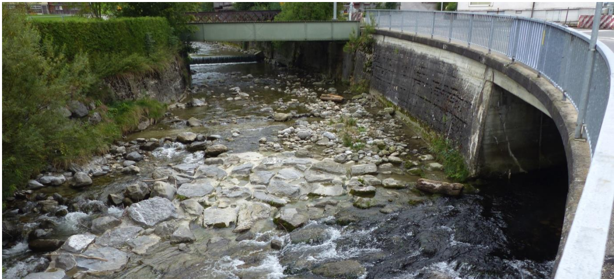
Naturfremde Stelle mit betonierter Gewässersohle und fehlendem Uferbereich (Zusammenfluss von Brüel- und Schwendibach zur Sitter bei Weissbad).

Natürliche Fliessgewässer weisen vielfältige Strukturen, dynamische Abflüsse und einen naturnahen Übergang zum Uferbereich auf. Die Nutzung der Gewässer durch den Menschen führt besonders durch Verbauungen der Gewässersohle und des Uferbereichs zu starken Veränderungen der Gewässerlebensräume.