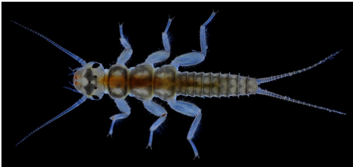
Steinfliege der Gattung Isoperla .

Der Zustand eines Gewässers wurde früher weitgehend anhand der chemisch-physikalischen Wasserqualität beurteilt. Um jedoch die Auswirkungen aller Belastungen auf die Lebensgemeinschaften in einem Gewässer beurteilen zu können, wird der Gewässerzustand auch biologisch untersucht. Aus der Zusammensetzung von Fauna und Flora lassen sich Rückschlüsse auf die Qualität des Gewässers ziehen, die allein mit chemischen Messungen nicht möglich sind. Neben der Wasserqualität kann mit biologischen Methoden auch der Einfluss der Gewässerstruktur, der Wassertemperatur oder des Abflusses erfasst werden.