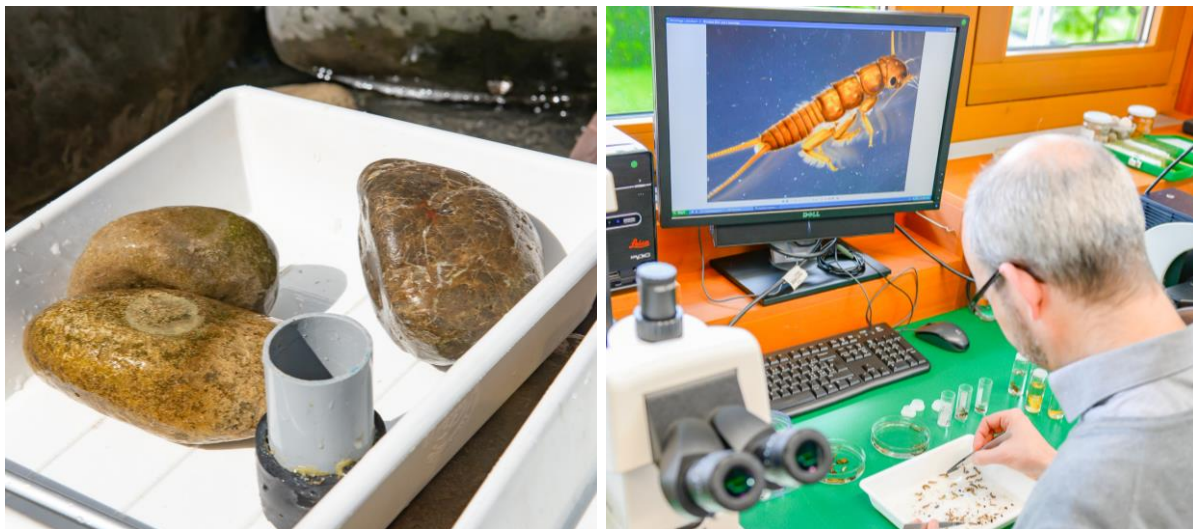
Abb 2: Bild links: Kieselalgen sind als brauner Bewuchs auf Steinen sichtbar; Bild rechts: im Labor werden die Lebensgemeinschaften des Makrozoobenthos aussortiert und bestimmt.

Der gewässerökologische Zustand der Fliessgewässer war im Oberlauf der Sitter gut, die ökologischen Ziele gemäss der Gewässerschutzverordnung Anhang 1 wurden erreicht. Im Unterlauf der Sitter ist die Zielerreichung an den Stellen OGT015 und OGT009 fraglich. Bei OGT015 ist ein möglicher geringer Einfluss der ARA St.Gallen-Au erkennbar.